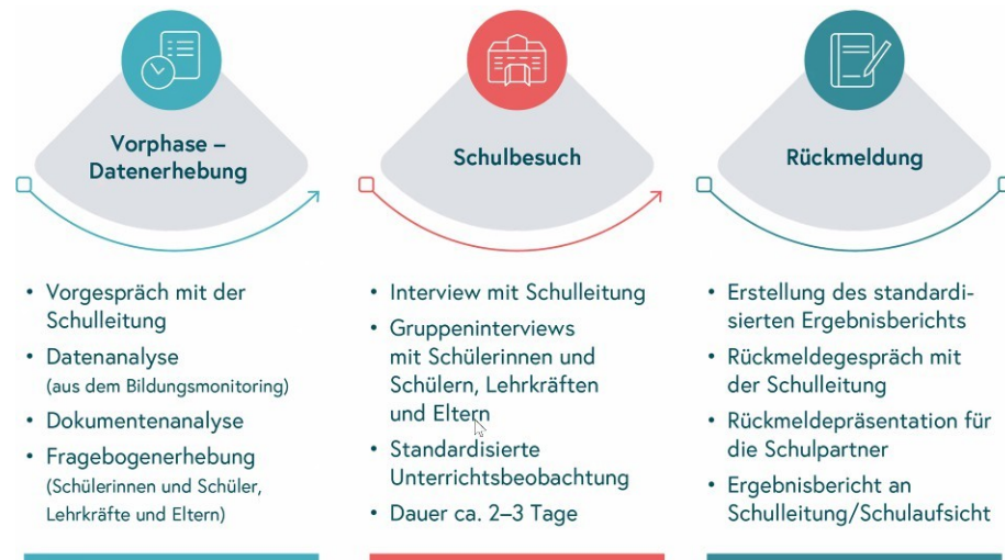
Abb. 2: Das Evaluationsverfahren im Überblick

Die externe Schulevaluation gliedert sich in drei Verfahrensabschnitte: