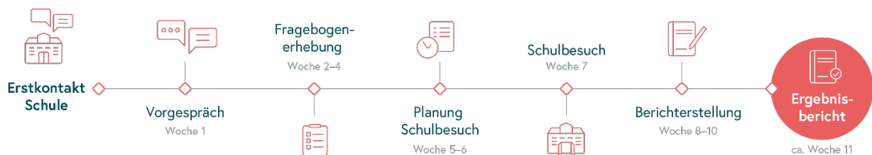
Abb. 3: Zeitlicher Ablauf des Evaluationsverfahrens