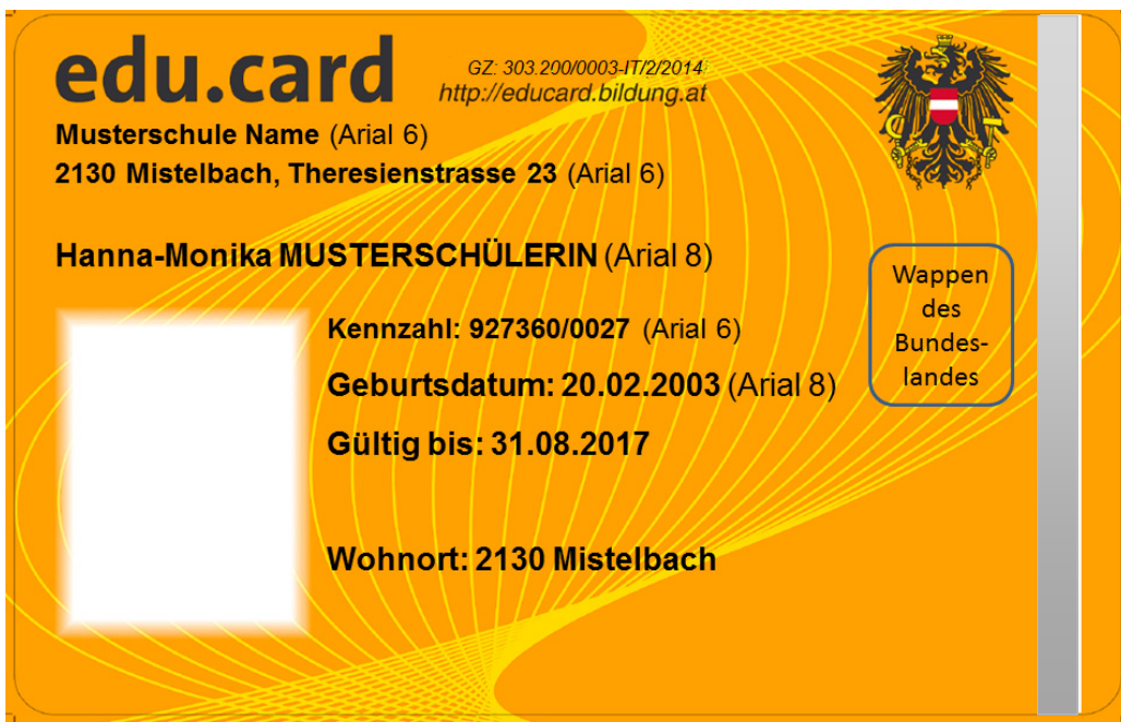
Muster für Vorderseite edu.card mit Landeswappen

Die Vorderseite der Karte ist folgendermaßen zu personalisieren: